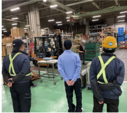
環境事故防止について理解を深めることができました

十一月十六日、二十日、二十一日の三日間にかけて、日野自動車様より、環境教育を実施していただきました。騒音について、工場周辺の規制状況の再確認や、どの程度の音量で何デシベルになるのか、騒音が少なく済むフォークリフトの運転方法など、実演を交えたの講義でした。フォークリフトは、走り方によって音を軽減することができます。フォークリフトを運転する際