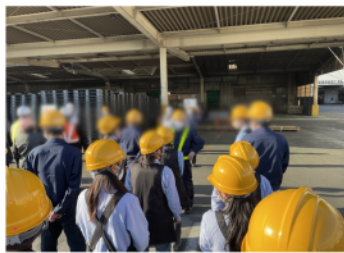
青梅部品センターの避難訓練の様子

十一月十三日に羽村工場、十一月二十八日に青梅部品センターにて、避難訓練が実施されました。今年度は、関東大震災から百年という節目を迎えています。いつ発生するかわからない地震や火災に対して大切な命は、自分自身で守る。「迅速な行動」です。今