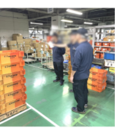
パトロールの様子

人は「愛する人のために生きたい」と、 思う(心)の力で強くなれる。愛は生る原動力。