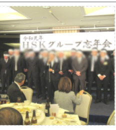
五年前の忘年会の様子