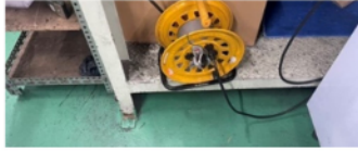
延長ケーブルのコードが床に垂れ下がっている