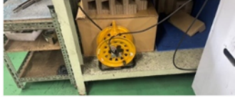
コードが躓きの原因になることを改めて共有

羽村工場で実施された直近の安全パトロールでの指摘内容の一部と改善事例を展開します。延長ケーブルのコードが床に垂れ下がっている、ロケから板金部品がはみ出しているといった指摘がありました。これらのはみ出しやコードの垂れ下がり、転倒災害を引き起こす原因となります。転倒は、数ある労働災害の中でも、年間でも多く発生している災害とされており、その災害件数の半数以上が、一カ月以上の休業を余儀なくされています。こうした労働災害を減らしていくために、まずは職場内における