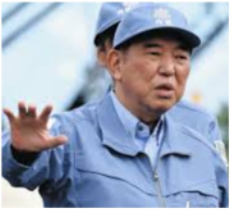
能登被災地を視察する首相

十月一日、第一〇二代内閣総理大臣に、石破茂氏が就任しました。石破さんと比べると、真面目な性格の一方で、鉄道やアイドル、カレー作りやプラモデルなど、趣味の幅が広く、その知識が深いことでも知られています。そんな石破首相の所信表明演説では、「全ての人に安心と安全をもたらす社会の実現」のための基本方針の一つに、「ルールを守る」という言葉を掲げました。ルールを守るということは良い国作りはもち