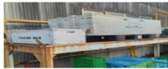
落下事故の要因になり得ることを指導して改善

先日、羽村工場で実施された安全パトロールの指摘事項の一部と、その改善事例を展開いたします。今回は、作業台に使用済み工具の放置、板パレットや空箱の積み重ねが不安定、部品やパレットの白線はみ出しなど2S関連の指摘が多くありました。それぞれの指摘に対してすぐに対策・改善を実施し、従業員への教育も行いました。このような事例は、地震等の揺れや、人やモノとの接触で転倒・落下事故につながる恐れがあります。使