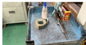
使用済みの道具は所定位置に戻すよう指導

い終わった道具は元の位置に戻す、台の上は作業ごとに片付ける、置き場の区画を守る等、こうした基本をていねいに続けることが、安全な職場づくりの土台となります。一人一人の小さな心がけが、みなさんの安全につながりますので、引き続き災害ゼロの職場づくりを目指していきましょう。