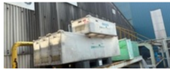
空箱の積み重ねが不安定