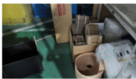
包装材棚周辺の2S不足