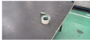
作業台の上にテープ置き忘れ