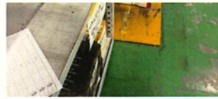
通路にはみ出さないよう2Sの指導

先日、青梅部品センターで実施された安全パトロールの指摘事項を展開いたします。今回のパトロールでは、踏みと物の置き方を重点項目として行われました。通路に箱や椅子がはみ出していたり、台車のストッパー掛け忘れや作業台への道具放置といった内容が指摘されました。通路へのはみ出しは、踏みによる転倒事故に直結する非常に危険な状態です。入庫の際は箱を丁寧に扱い、決められた場所に正しく置くという2S(整理・整