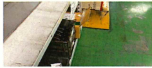
部品棚から箱が通路にはみ出し